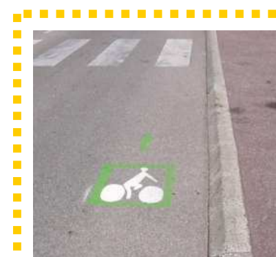
Jalonnement de l'itinéraire par un pictogramme vélo